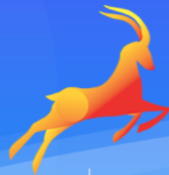
Tianjin-Gazelle Enterprises 天津瞪羚企业