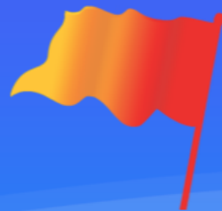
Tianjin Science and technology leading enterprises 天津科技领军企业