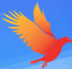
Tianjin-Eagle Enterprises 天津雏鹰企业